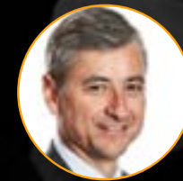
Jean-Philippe Courtois Président de Microsoft International Fondateur Live for good