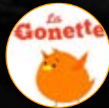
La Gonette La Gonette